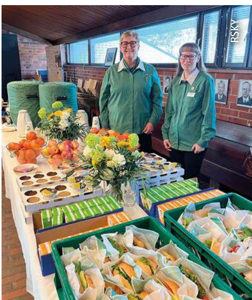
Kokousvieraat aloittivat päivän aamiaisella.

Rannikkosotilaskotiyhdistyksen sääntömääräinen vuosikokous pidettiin naistenpäivänä 8. maaliskuuta Upinniemen Merikappelissa. Edellisestä kerrasta Upinniemessä oli kulunut jo useita vuosia.