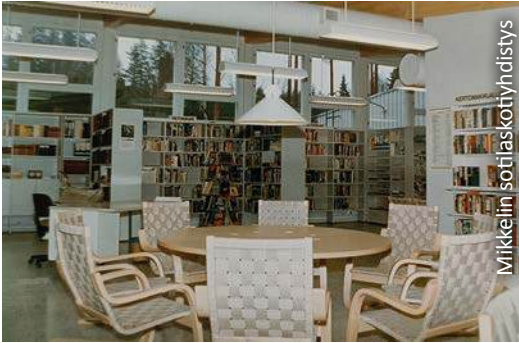
Kirjasto Karkialammen sotilaskodissa.