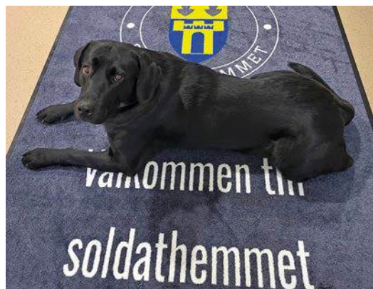
Joissakin Ruotsin sotilaskodeista voi tavata työntekijän koiran. Östersundin sotilaskodissa lemmikkinä on Bingo.

Vierailun jälkeen järjestö on toteuttanut keräyksen YMCA Lvivin hyväksi ja tekee parhaillaan yhteistyötä YMCA:n kanssa hankkeessa, jossa ukrainalaisia veteraaneja autetaan kirjoittamaan kokemuksistaan. tarinat käännetään muille kielille – tässä tapauksessa ruotsiksi – ja paikalliset veteraanit lukevat ne äänitteiksi. Näin sodan kokemuksia voidaan välittää Ukrainan rajojen ulkopuolelle, jotta ne tulevat sekä luetuiksi että