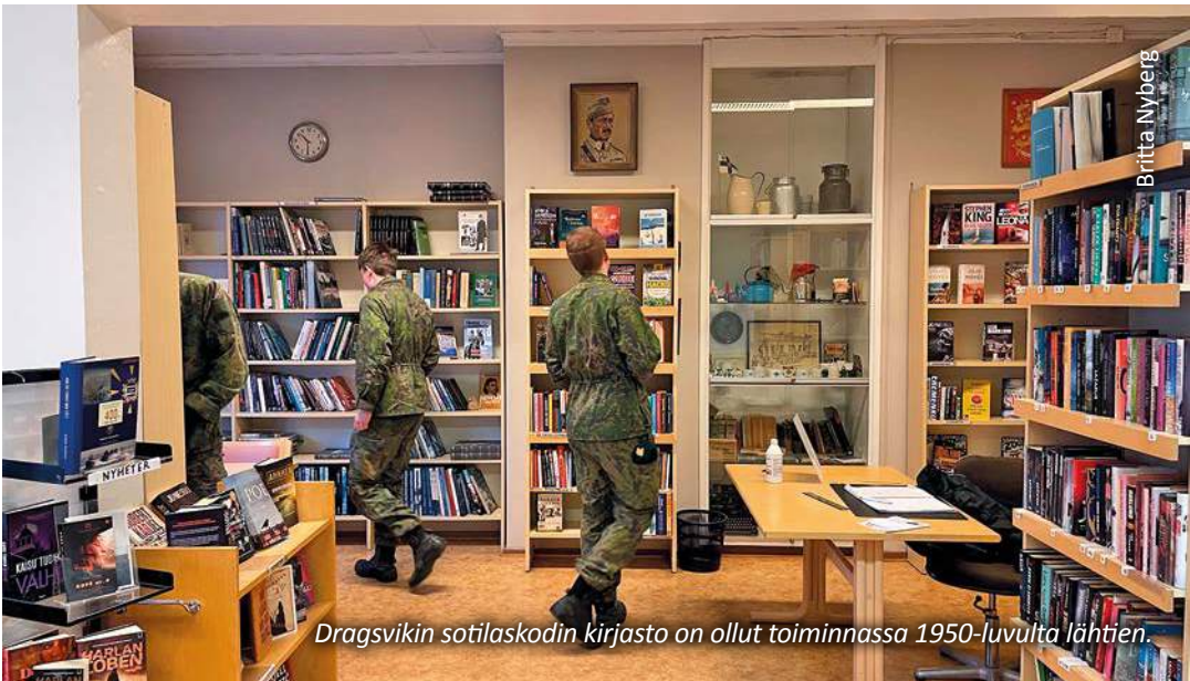
Dragsvikin sotilaskodin kirjasto on ollut toiminnassa 1950-luvulta lähtien.