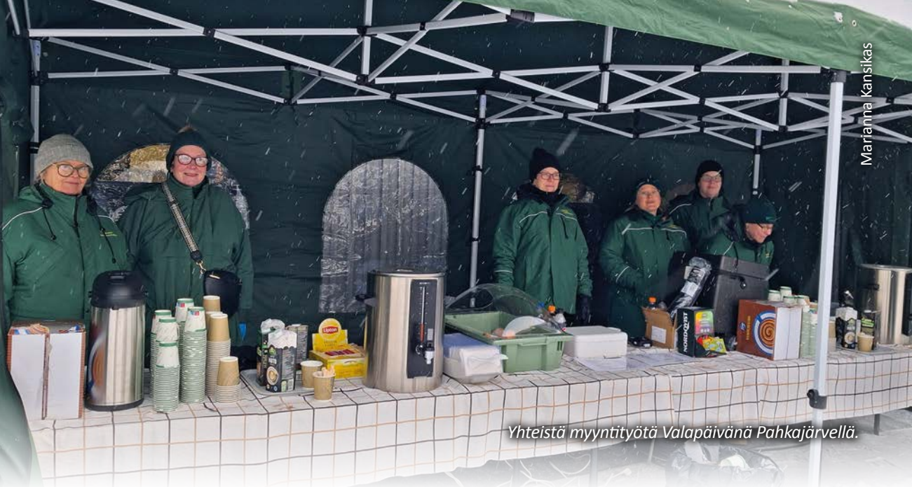
Yhteistä myyntityötä Valapäivänä Puhkajärvellä.