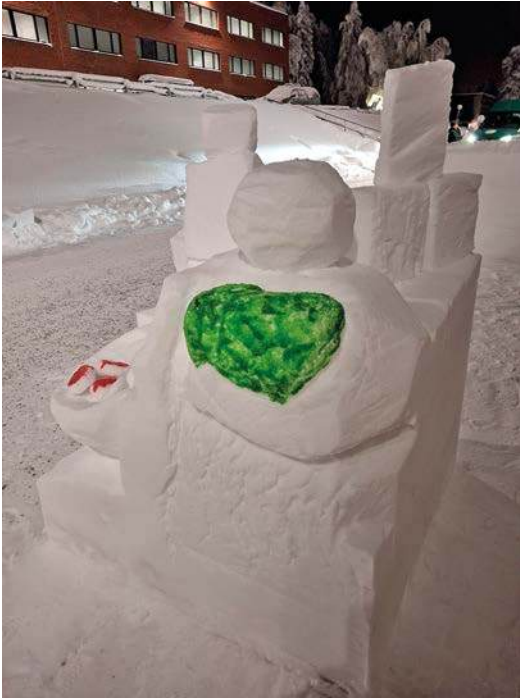
Sotilaskotisisaret veistivät oman kuution.