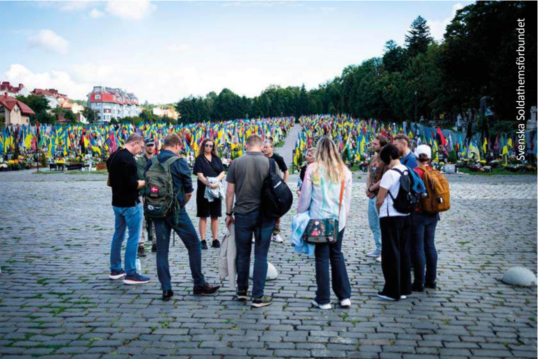
Hartaus- ja opintomatka Ukrainan Lviviin, jossa Ruotsin ja Tanskan sotilaskotijärjestöt kartoittivat yhteistyön mahdollisuuksia.

noiva ja hallinnollinen rooli, mutta myös tehtävä tukea sotilaskoteja niiden työssä.