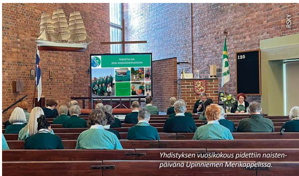
Yhdistyksen vuosikokous pidettiin naistenpäivänä Upinniemen Merikappellissa.