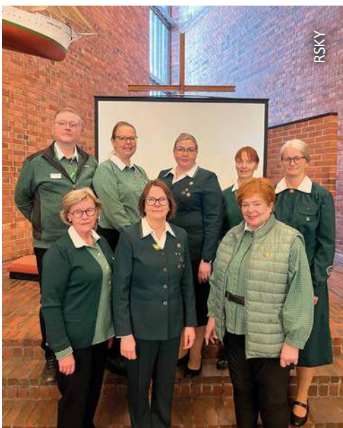
Yhdistyksen hallituksen jäseniä Upinniemen vuosikokouksessa.