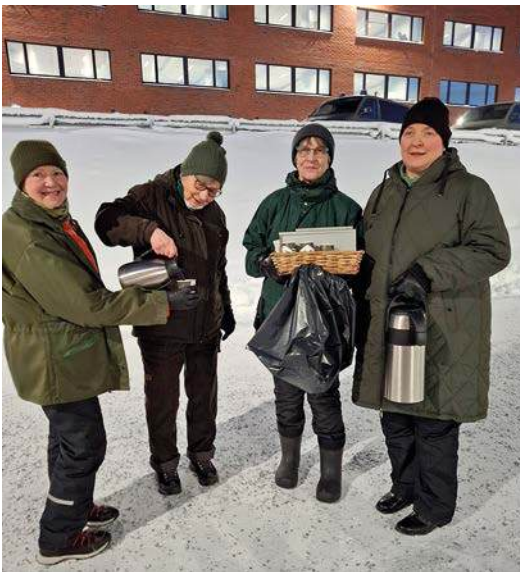
Kisaajille tarjoihtiin lämmintä glögiä ja jaettiin pienet palkinnot.